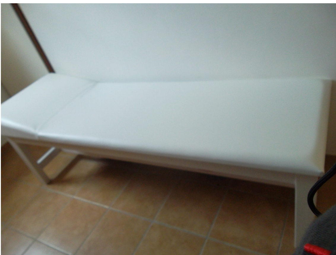
Vizsgálópamlag / fektetőágy fa fix fejrészsel (leltári szám: )