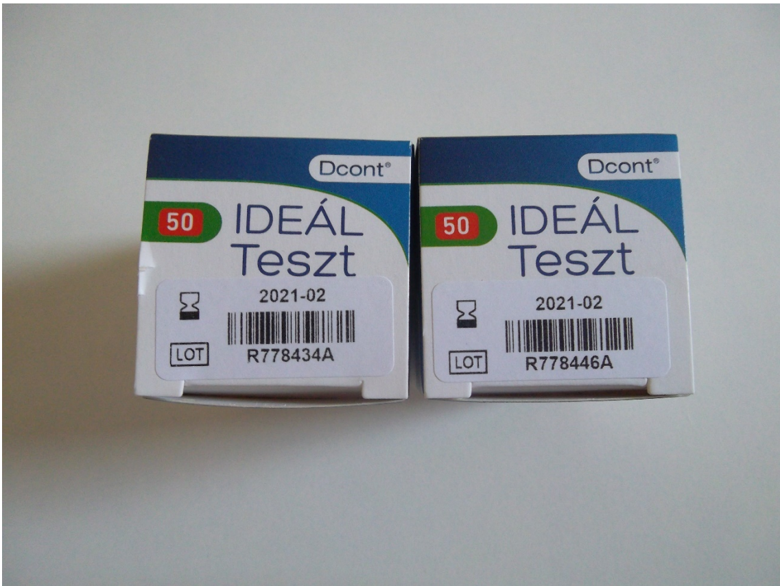
Vércukor tesztcsík IDEAL (2 db) (leltári szám: )