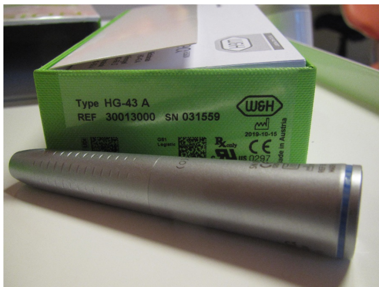
G-43A Synea FUSION egyenesdarab (leltári szám: )