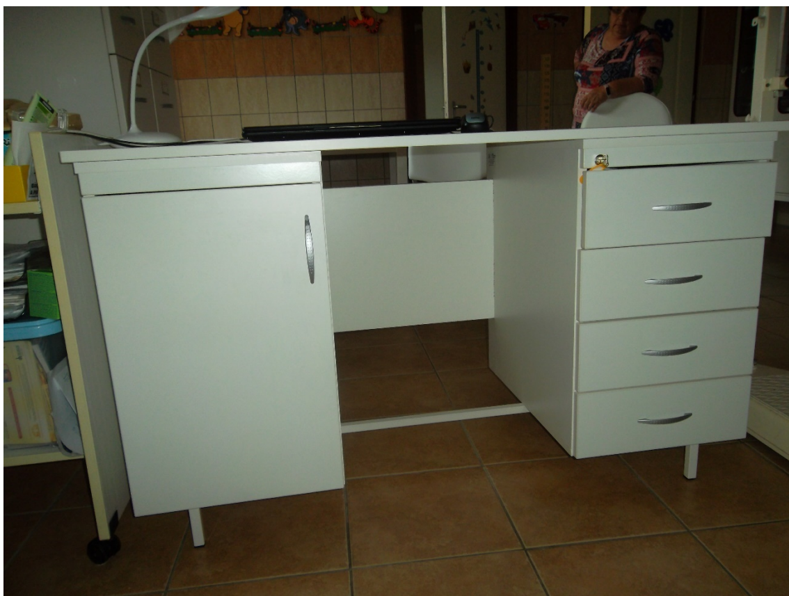
Íróasztal (leltári szám: )