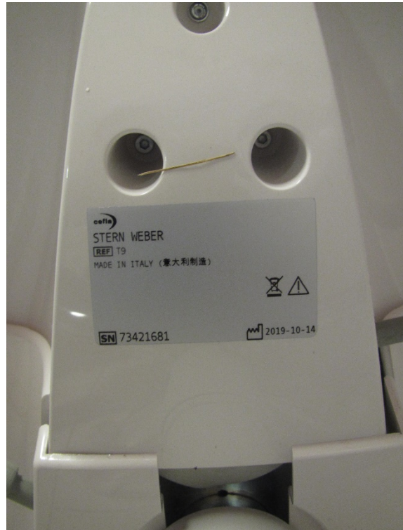
Stern Weber T9 orvosi szék (leltári szám: )