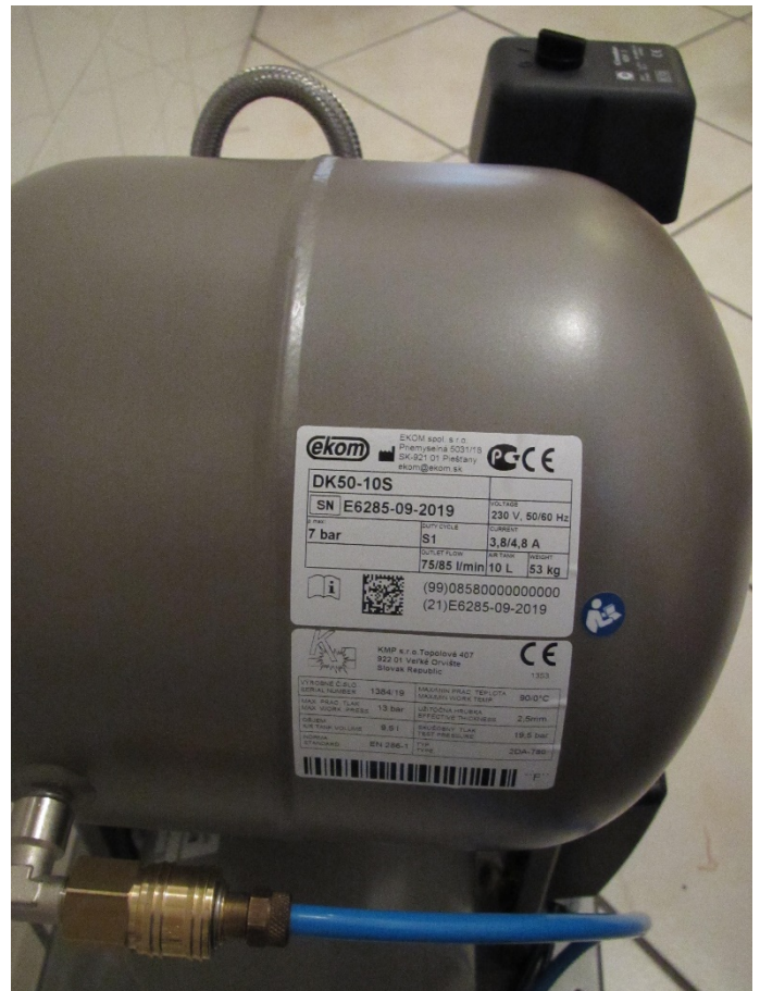
Ekom DK 50.10S kompreszor (leltári szám: )