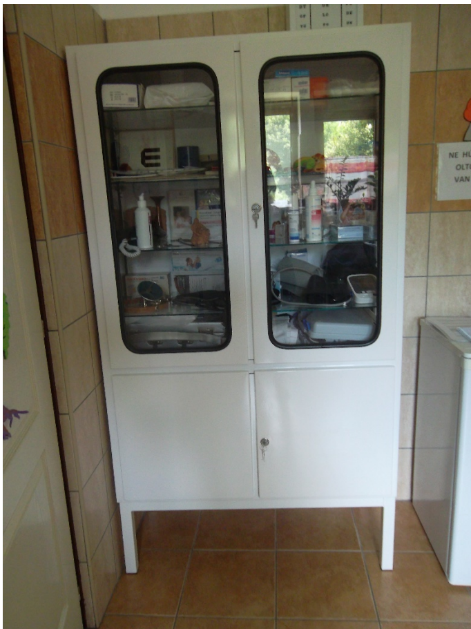
Műszerszekrény 2x2 ajtós fém (leltári szám: )