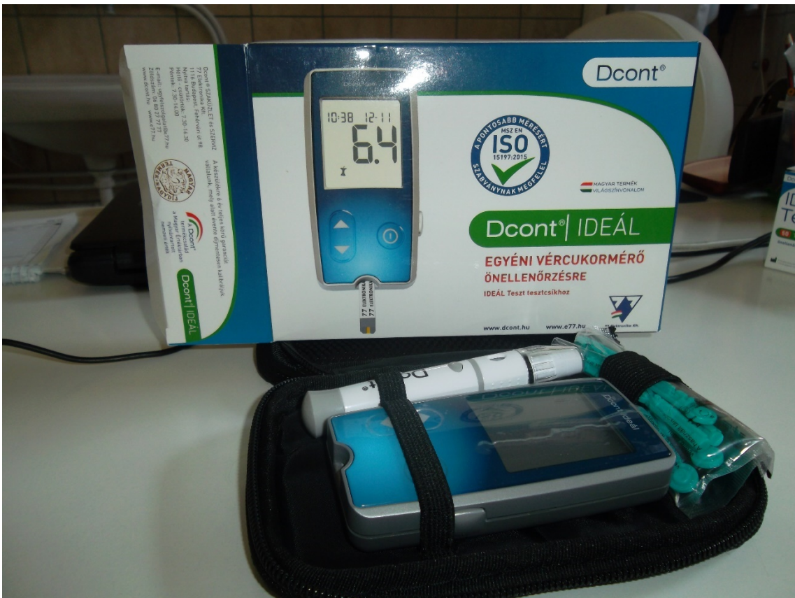
Vércukormérő D-Cont IDEAL (leltári szám: )