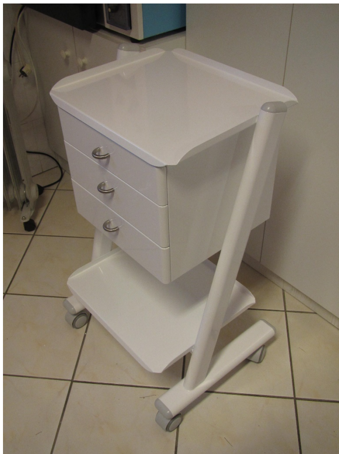
Gördíthetó mőszerasztal C2RK3 (leltári szám: )