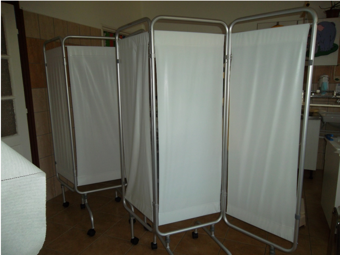
Paraván 3 részes alumínium vázzal görgős (2db) (leltári szám: )