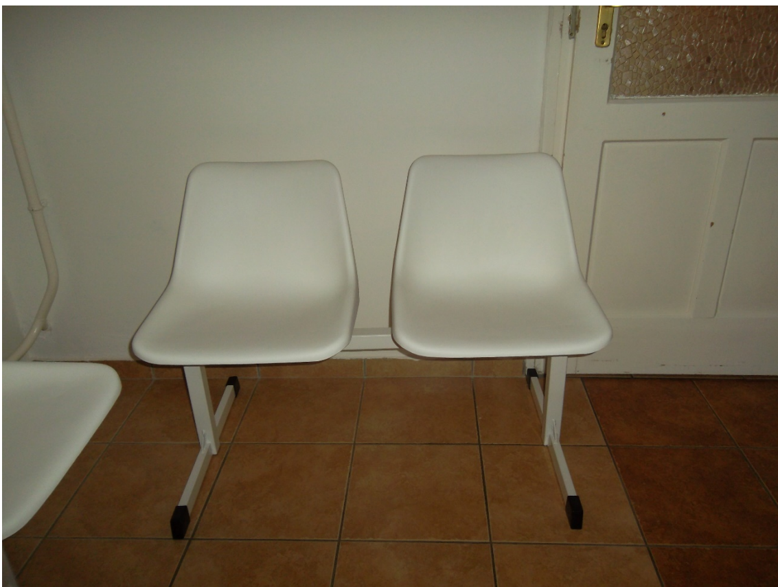
Várótermi pad műanyag Gabi ülőkével 2 személyes (2 db) (leltári szám: )