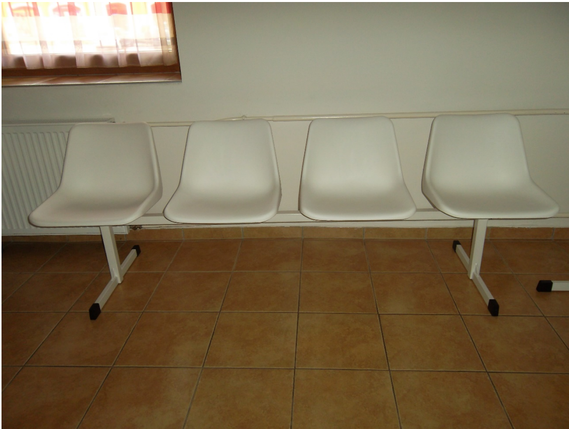
Várótermi pad műanyag Gabi ülőkével 4 személyes (3 db) (leltári szám: )