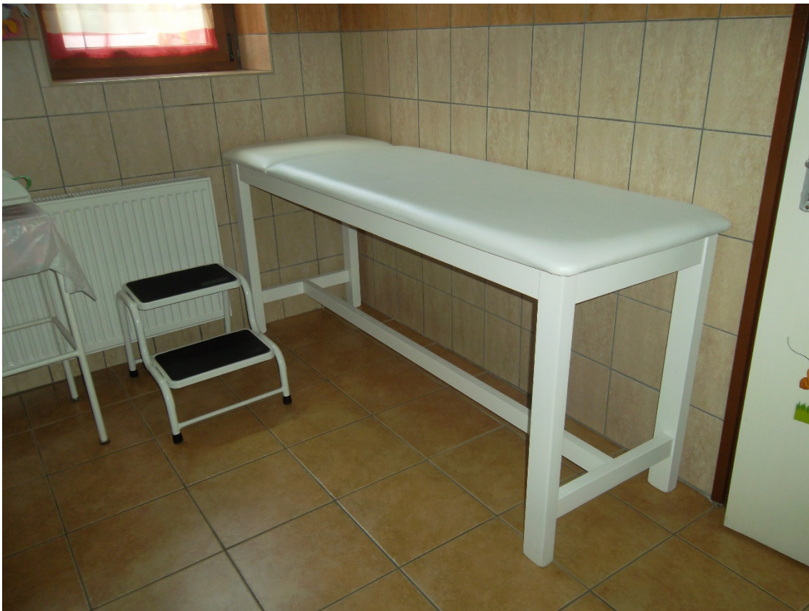
Vizsgálóágy fa emelhető fejrészsel 820mm magas(eltári szám: )