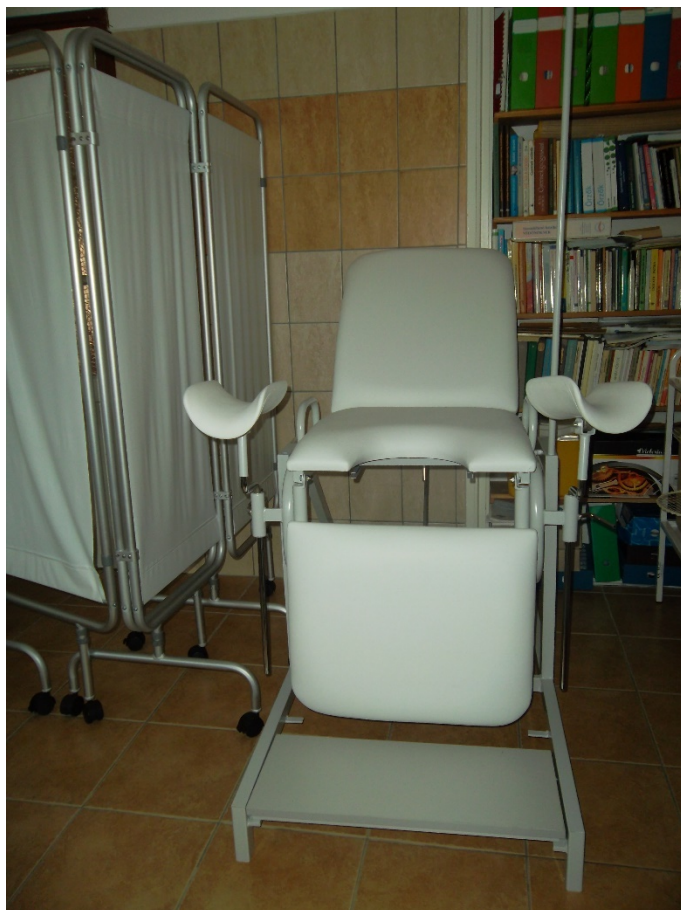
Nőgyógyászati vizsgálószék / vizsgáló ágy (leltári szám: )