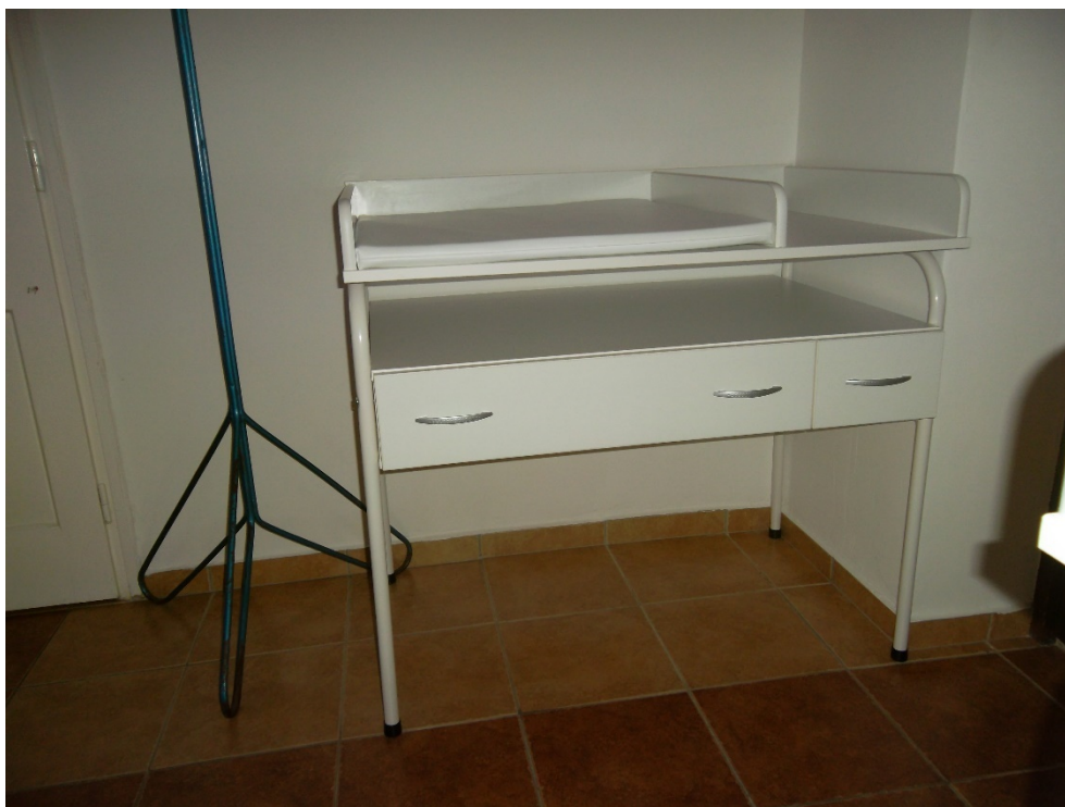
Pólyázó asztal, fém vázas egyrészes (leltári szám: )