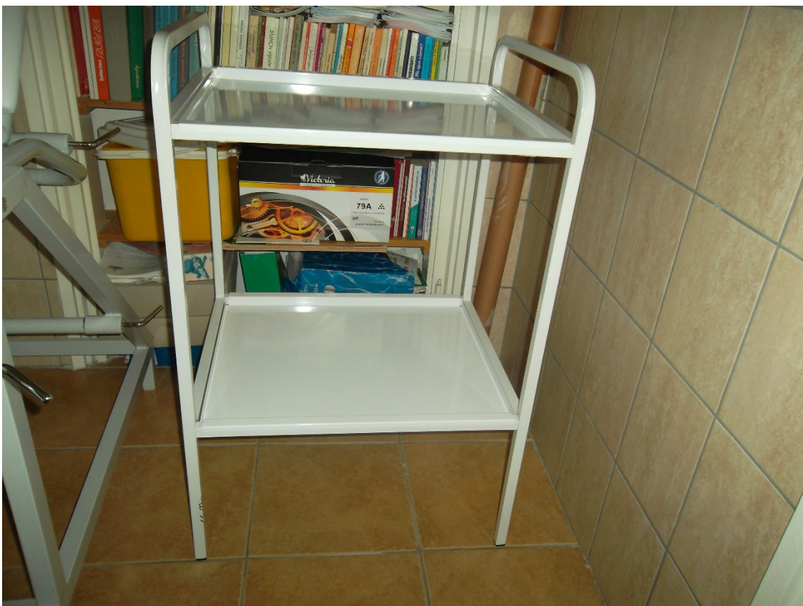
Műszerasztal lemezlapos fix (eltári szám: )