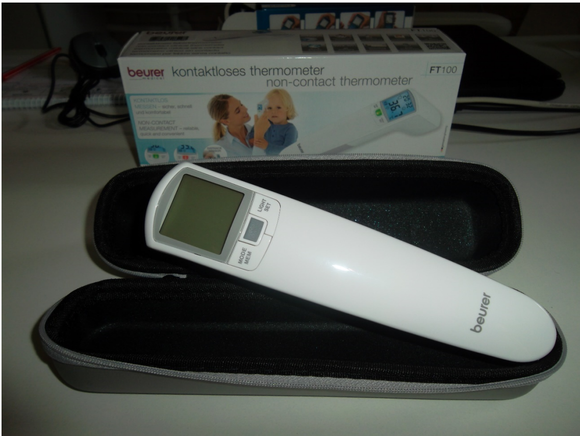
Lázmérő érintés nélküli BEURER FT100 (leltári szám: )