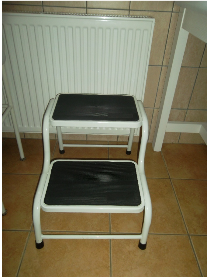
Ágyfellépő kétlépcsős (leltári szám: )