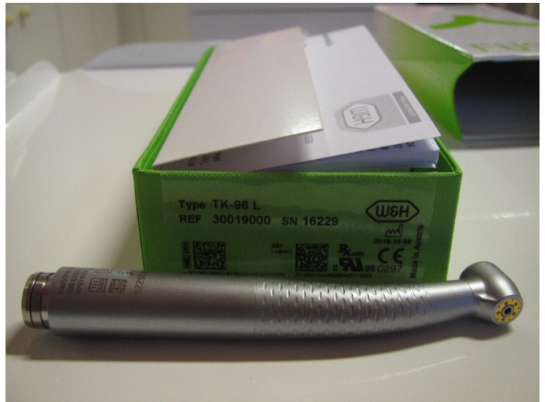
TK-98L Syneca VISION turbina (leltári szám: )