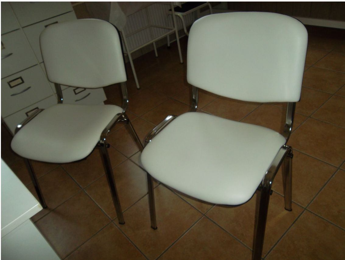
Króm lábú támlás szék ISO FULL (2 db) (leltári szám: )