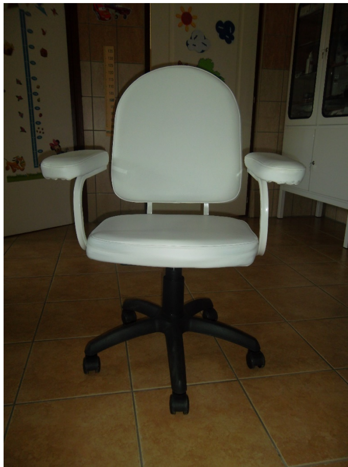
Görgös forgósék karfával, gázrugós(leltári szám: )