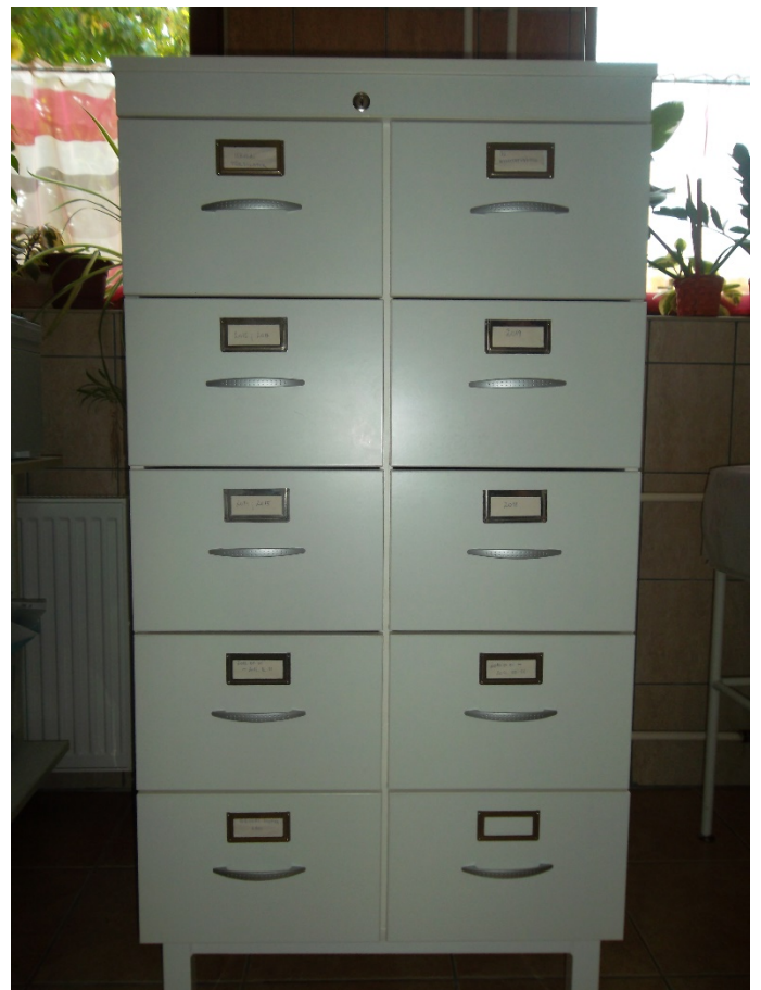
Kartoték szekrény 2x5 fiókos (leltári szám: )