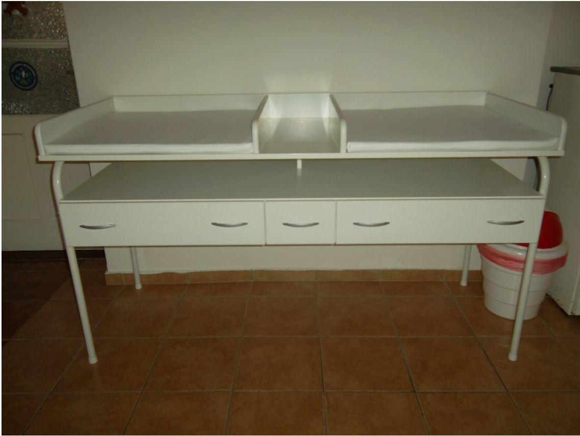
Pólyázó asztal fémvázat 2 részes (leltári szám: )