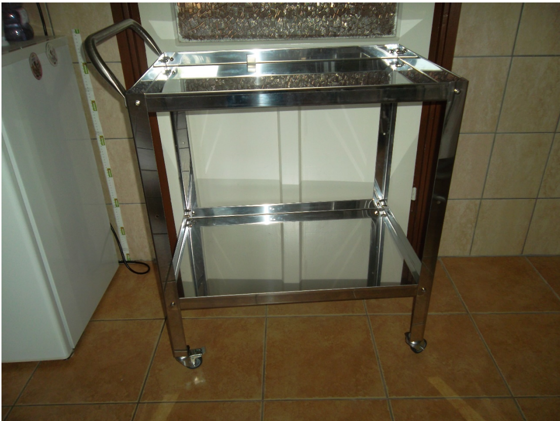
Műszerasztal rozsdamentes 50x75x85 cm (leltári szám: )